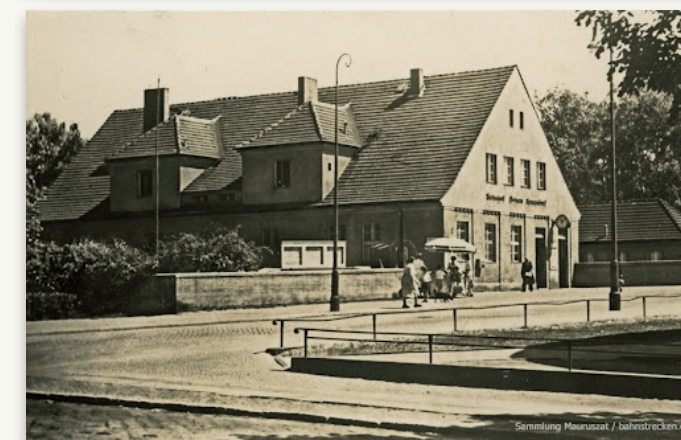
Bahnhof 1924 und 1925